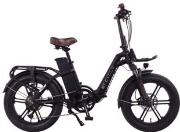
ET.CYCLE F720 20"